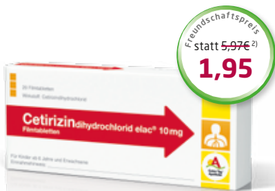
Cetirizin elac ® 10 mg 20 Filmtabletten