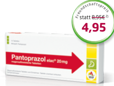
Pantoprazol elac ® 20 mg 14 magensaftresistente Tabletten