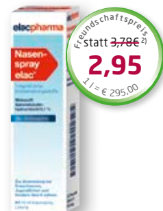
Nasenspray elac ® ohne Konservierungsstoffe 10 ml

Freundschaftspreis statt 3,78€ 2) 2,95 2 l = € 295,00