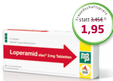
Loperamid elac ® 2 mg 10 Tabletten