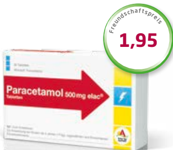
Paracetamol 500 mg elac ® 20 Tabletten