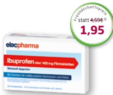
Ibuprofen 400 mg elac ® 20 Filmtabletten