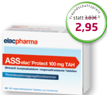
ASS elac ® 100 mg TAH 100 magensaftresistente Tabletten