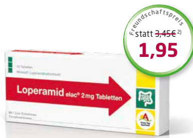
Loperamid elac ® 2 mg 10 Tabletten