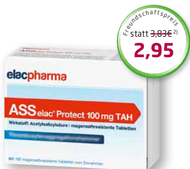
ASS elac ® 100 mg TAH 100 magensaftresistente Tabletten