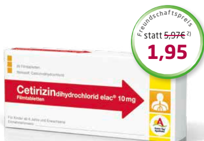
Cetirizin elac ® 10 mg 20 Filmtabletten