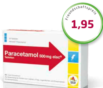
Paracetamol 500 mg elac ® 20 Tabletten