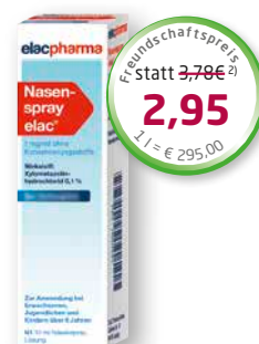
Nasenspray elac ® ohne Konservierungsstoffe 10 ml