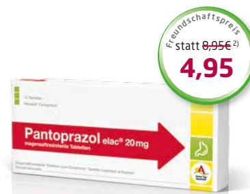
Pantoprazol elac ® 20 mg 14 magensaftresistente Tabletten