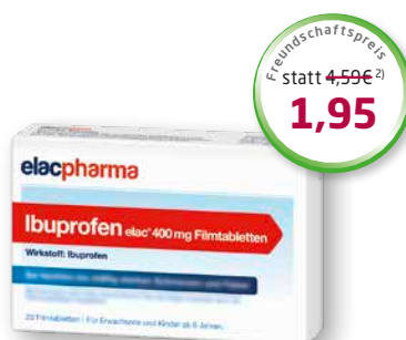
Ibuprofen 400 mg elac ® 20 Filmtabletten